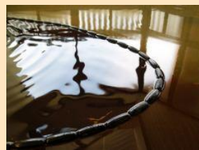
湯治湯としても人気の「豊富温泉」