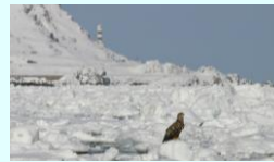
名勝「神威岬」と「流氷」