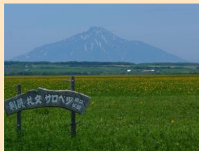
雄大な景観を望む「サロベツ原野」

また、生乳生産量は管内一となっており、四季の変化を感じる自然豊かな酪農と観光の町です。