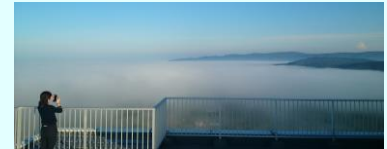
枝幸の街並みを包み込む「雲海」 (三笠山展望閣から)