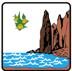
礼文町 Rebun Town