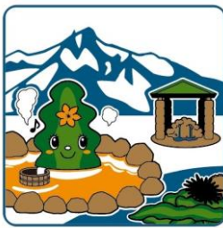
利尻町 Rishiri Town