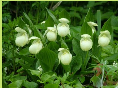
レブンアツモリソウ

映画「北のカナリアたち」のロケ校舎を一般開放した「北のカナリアパーク」は、新たな観光の目玉となっています。