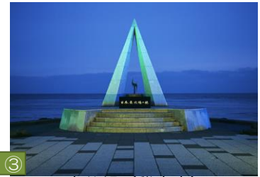
③ 宗谷岬（稚内市） 北緯45度31分22秒に位置する日本の「てっぺん」。日没後はライトアップされ、幻想的な秀麗な風景です。