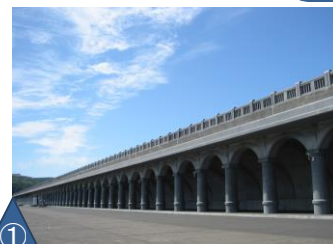
① 稚内港北防波堤ドーム（稚内市）