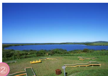
② メグマ沼 稚内空港にほど近いところにある、丸い形をしたメグマ沼。沼周辺約78haの湿原では、エソカンソウやノハナショウブなど約200種類の花が咲きます。