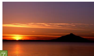
⑦ パンケ沼（幌延町） パンケ沼にはイトウが生息し、秋にはヒシクイや雁等の渡り鳥の通り道にもなっています。