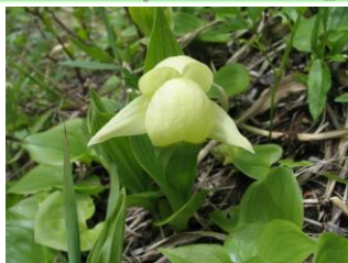
レブンアツモリソウ