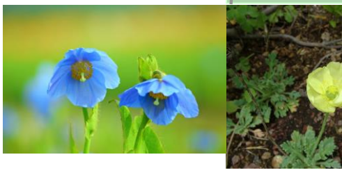
ブルーポピー リシリヒ