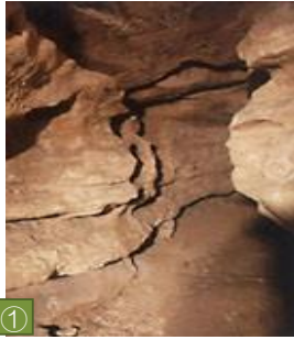
① 中頓別鍾乳洞（中頓別町） 1000万年前は海の底だったといわれる鍾乳洞。石灰岩が長い年月をかけ溶けてできた単層岩なども観ることができます。