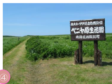
④ ベニヤ原生花園 オホーツク海に面した浜頓別町に広がる原生花園。海沿いに広がる約330haの原生花園には、春から秋にかけてエソカンソウなど約100種類の花が咲きます。