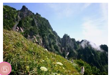
⑤ 利尻島の高山植物 日本海に浮かぶ利尻島は、貴重な高山植物の宝庫となっており、リシリヒナゲシやリシリゲンゲのような利尻島固有種も観ることができます。