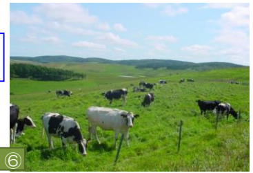
⑥ おおきほそうちぼくじょう 大規模草地牧場（豊富町） 総面積1400haと日本有数の規模を誇る牧場。見渡す限り続く丘陵地帯には、乳牛が放牧され牧歌的な風景を見せています。