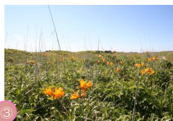
③ エサナカ原生花園 猿払村に広がる原生花園。あまり人の手が入っていないのが特徴で、ハマナスやワタスゲ、コケモモなど数十種の花が咲きます。