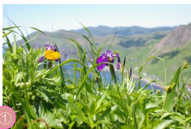
① 「花の浮島」礼文島 礼文島は、夏に約300種類の花が咲く「花の浮島」となります。レプンアツモリソウやレプンウスユキソウなど礼文島固有種もあります。