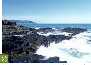
② ウスタイベ千畳岩（枝幸町） 一面に畳を敷きつめたような岩々が波打ち際まで広がり奇観を呈しています。冬には間近に流氷を観ることができます。