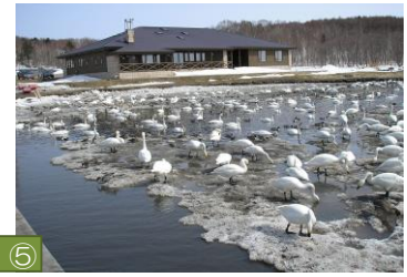
⑤ クツチャロ湖（浜頓別町） 平成元年、日本で3番目にラムサール条約登録湿地に指定されました。春と秋には約2万羽もの白鳥を観ることができます。