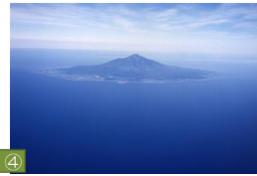
④ 利尻山（利尻町・利尻富士町） 利尻山はその美しい姿から「利尻富士」とも呼ばれています。標高1,721メートルで、日本の名山百選にも選ばれています。