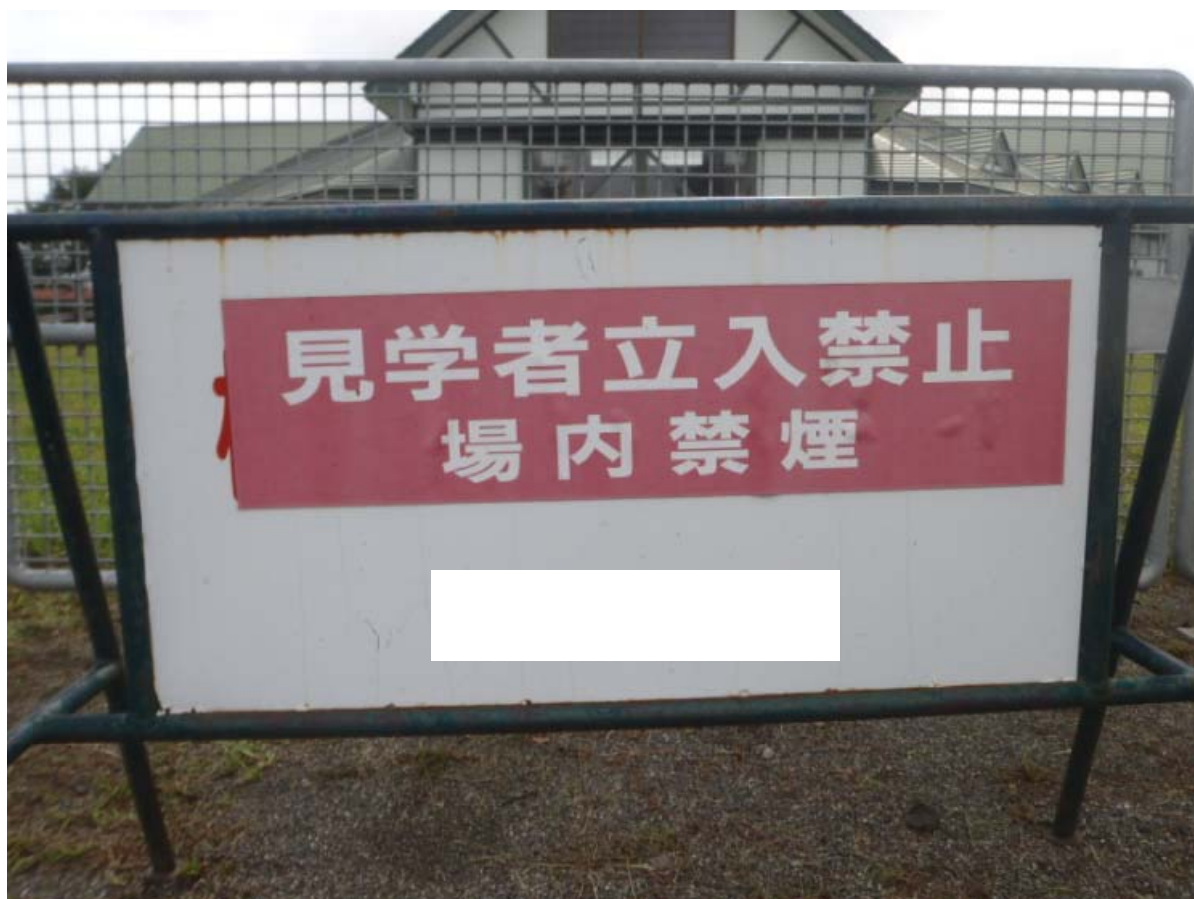
柵による区分別と看板