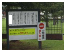
農場出入口の立看板