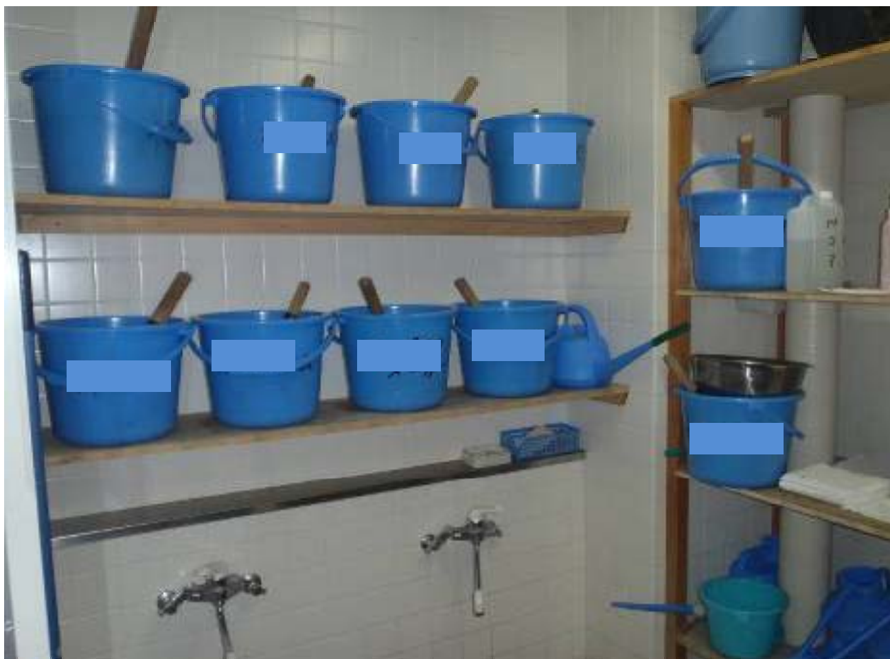
器具は馬ごとに管理