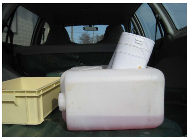
長靴用消毒容器の車載例