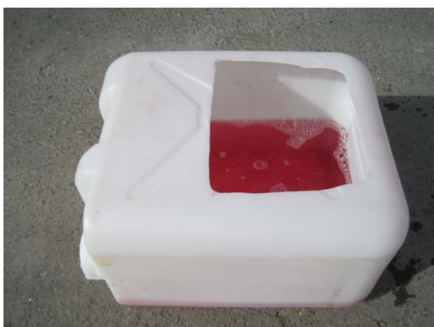
ポリタンクを改良した長靴用消毒容器