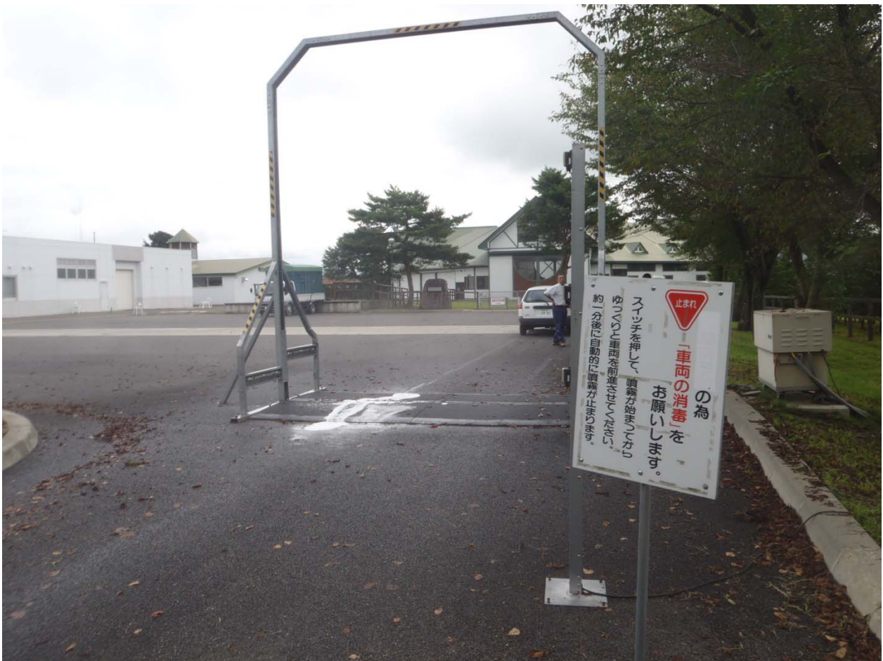
車両消毒用ゲート