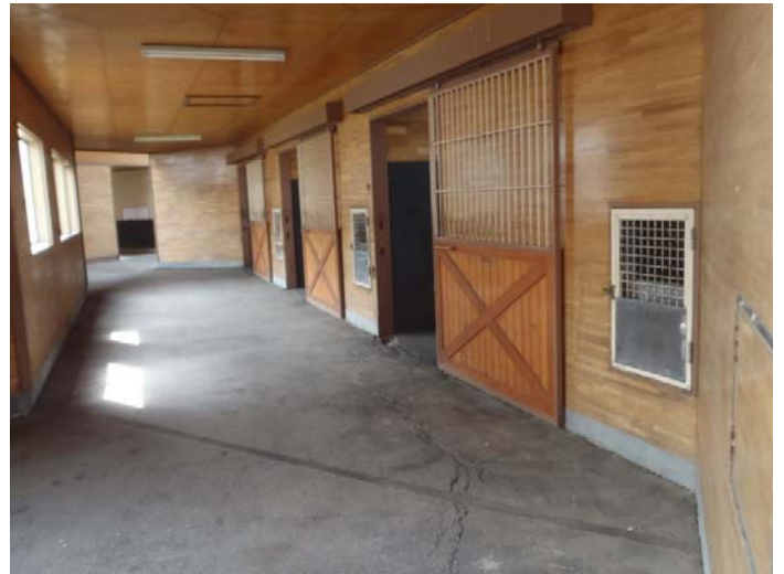
手入れされた厩舎