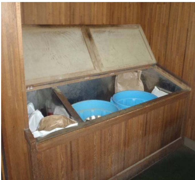
蓋のついた飼料保管庫