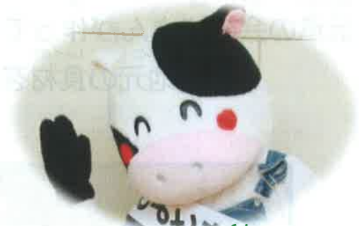
とよとみくん とよとみ君