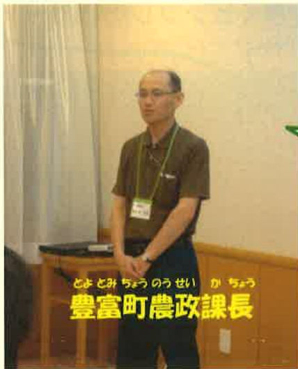
とよとみ ちょうのうせい か ちょう 豊富町農政課長

あと この後は、 とよとみ おんせん 豊富温泉でゆったりくつろぎ、 あした げんき たの 明日も元気に楽しんでください！