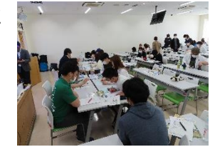
R 5 宗谷酪農セミナー（日本獣医生命科学大学）の個別相談会の様子