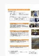
宗谷で活躍する人