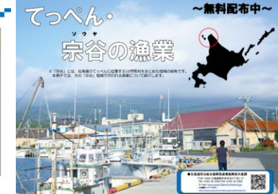
宗谷の漁業と活躍する漁業者を紹介するPR冊子