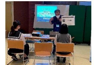
R 5 企業説明会（豊富高校）