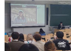
R 5 宗谷酪農セミナー（日本大学）の様子