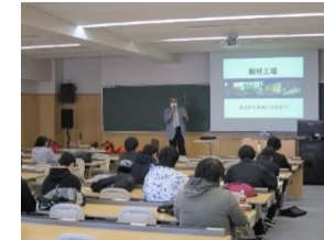
R 5 学校訪問（育英館大学）