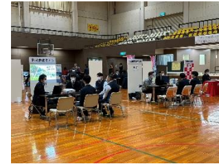
しごとと発見フェア