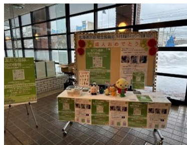
稚内市20歳の集いでの振興局ブースの設置(左)及びPRカード配付(右)