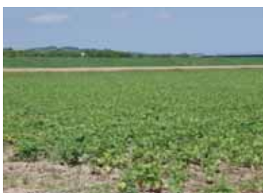
被害が最小限であった整備ほ場

基盤整備の効果は絶大なので今後も大いに取り組んで行くつもり。是非パワーアップ事業は継続をお願いしたい。