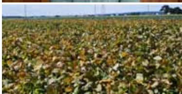
防除やカルチ掛け等の機械作業が スムーズに行えた整備済ほ場

現在、暗きょ排水の追加工事を申し込んでいるので、補助事業での対応をお願いしたい。