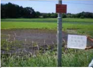
被害が発生した地域の整備予定ほ場