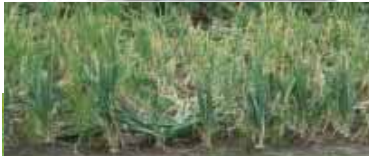
7月の長雨で生育不良となった 玉ねぎ(上) 大豆(下)

経営規模拡大により基盤の整備が間に合わず、個人で暗きょ排水を毎年少しずつ行っていますが、資材費に対する支援があればと思います。