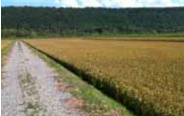
十分な畦畔高が確保された整備済ほ場

今後も一人の農家として、そしてJA東神楽の理事としても、 基盤整備をしっかりと行い、その効果を地域のブランド力向上に繋がっていきたい。