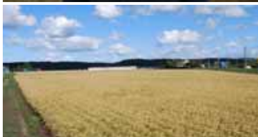
十分な畦畔高と耕作道が確保され、 管理作業も容易となった整備済ほ場