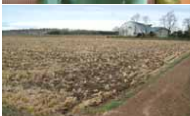
基盤造成が終わり、 客土の冬工事を待つ整備中のほ場

冷湿害に強い基盤づくりを早急に行うためにも、地元要望に応える事業予算の確保をお願いしたい。