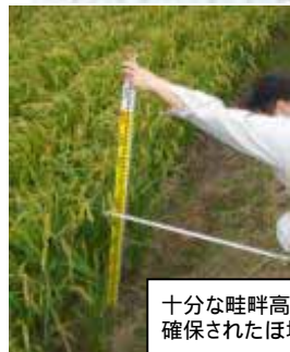
十分な畦畔高が 確保されたほ場