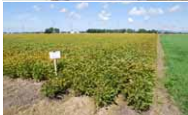
降雨後の水はけが 大幅に改善された 整備済ほ場

予算削減などで基盤整備が遅れると、営農に支障を来すので、恒久的な助成措置を期待したい。