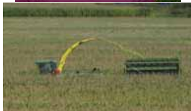
順調に収穫できた整備済みほ場

堆肥の有効活用や十分な施肥管理と併せて、適期に機械作業を行うことが生産量を確保する上でベストだと思います。