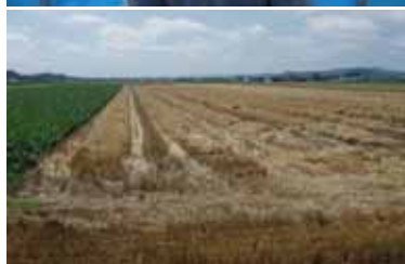
地域で早めに収穫が出来た整備ほ場

未整備ほ場では、溝切りやポンプで排水するなど大変でした。国や北海道の予算が厳しいのは理解しますが、基盤整備は引き続き行うべきです。