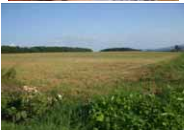
作業に苦慮する未整備ほ場

私たちの地域では、暗きょ排水は必須の装備。未整備のほ場がまだ残っているので、パワーアップ事業の継続を強く要望します。