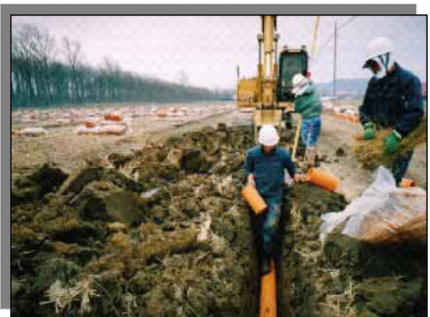
暗きょ排水の施工のようす