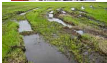
未整備ほ場では作業機械により泥濁...