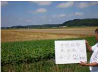
苦労した未整備ほ場