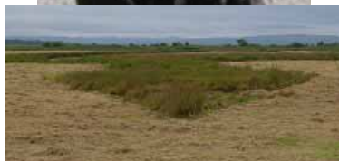
未整備ほ場では、地表水残留による刈り残しがみられた