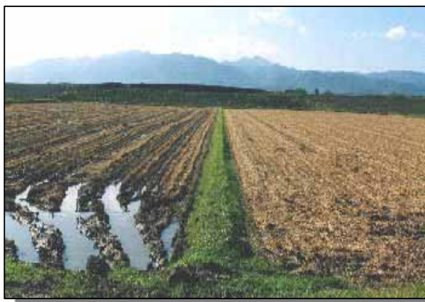
未整備ほ場（左）と暗きょ排水整備ほ場（右）