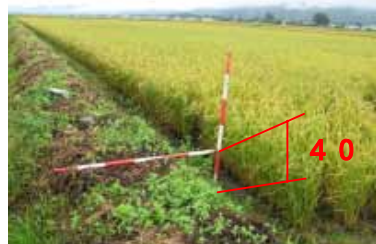
十分な畦畔高が確保され、 深水管理のほか排水状態も良好 (写真:美唄市光珠内地区)

平成22年度に区画整理を実施しますが、ほ場1枚毎の用排分離のほか、畦畔の高さの確保は深水管理に重要な整備です。また、大区画化によりレーザーレベルも必要となるので、農家負担率は現状程度とし、小規模で機動的に実施できる活用しやすい制度があれば良いと思います。