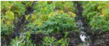
(写真:長沼町長沼北地区)