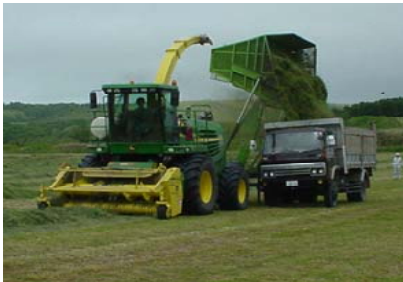
草地整備と排水改良により、大型機械による牧草収穫が可能になった。