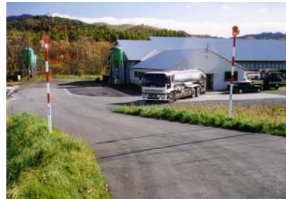
農道整備を行うことで集乳車の大型化が進み、スピーディーで効率的な集乳作業になった。