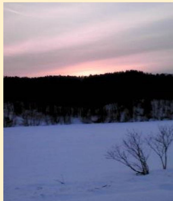
④ピンネシリ温泉から見た、西に沈む夕陽です。