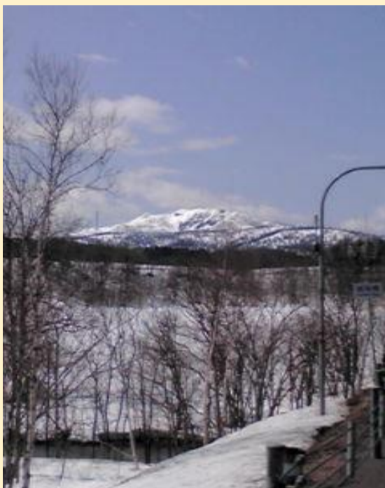
③敏音知岳近くを走る国道275号線から、幌延町方面にある知駒岳(シレコマダケ532m)振り返ると、このような景色です。