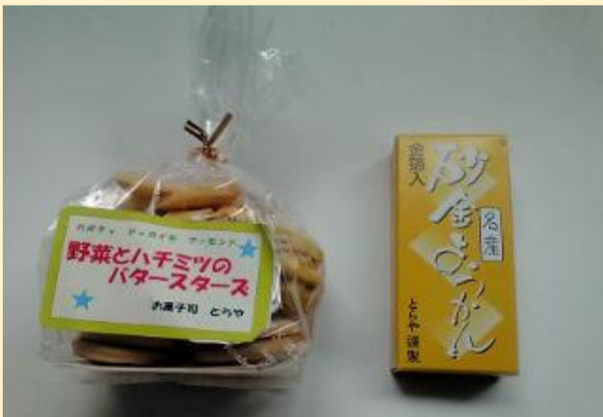
⑤明治時代、中頓別町のペーチャン川では砂金が発見され、ゴールドラッシュに沸きました。今でも、わずかながら砂金が採掘できます。これにちなんだ特産品として、「砂金ようかん(写真右)」があります。また、中頓別町には養蜂農園もあり、ハチミツを活用した食品(写真左)も豊富です。これら特産品は、道の駅ピンネシリでも販売しています。