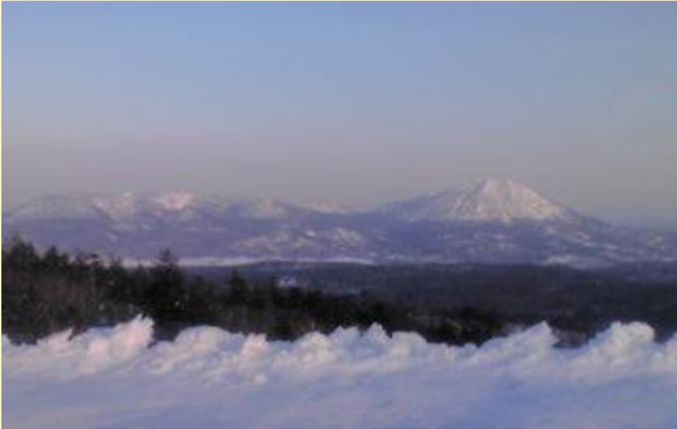
①幌延町と中頓別町の境界に位置する知駒岳の山頂付近から撮った敏音知岳(ピンネシリダケ704m:写真右)と松音知岳(マツネシリダケ519m:写真左)。