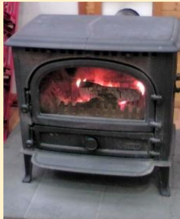
⑥林業も盛んな中頓別町。道の駅ピンネシリの中では、写真のようなストーブで薪を燃やし、部屋を暖めていました。静かな部屋の中に、時折「パチッ、パチッ」と薪の燃える音が響き渡ります。とても趣き深く、懐かしい気持ちになります。