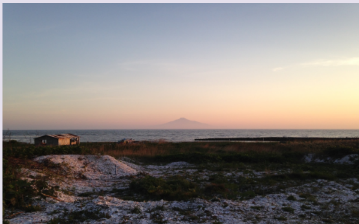
稚内西海岸(日本海側)から見た利尻島