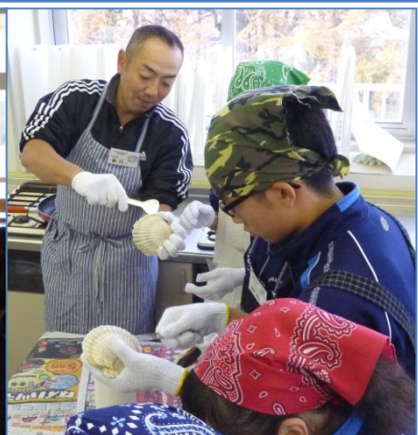
貝剥きを指導する 新川青年漁業士