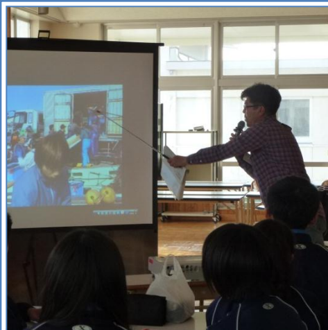
講師を務めた 和田指導漁業士