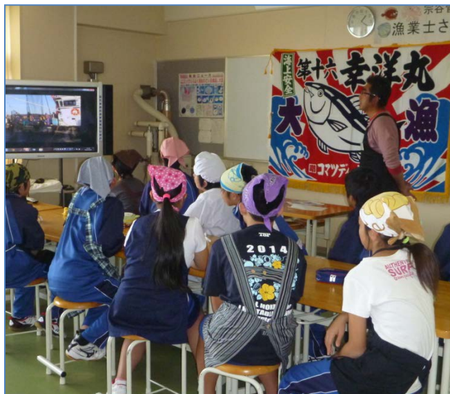
サケ漁の方法等について説明する戸田指導漁業士と話を聞く生徒達