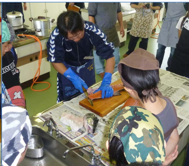
3枚おろしを披露する西野青年漁業士と見学する生徒達