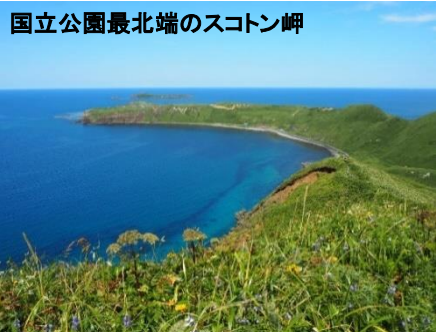
国立公園最北端のスコトン岬