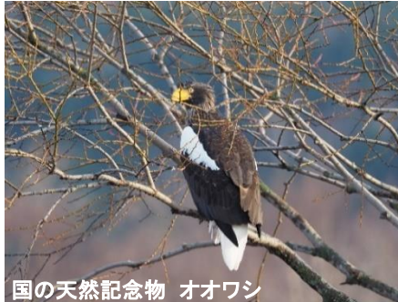
国の天然記念物 オオワシ