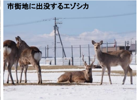
市街地に出没するエゾシカ