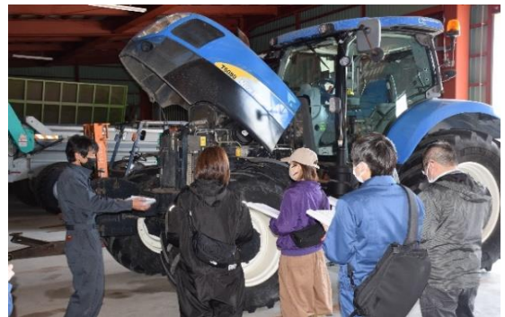
酪農の基礎を学ぶ現地研修会