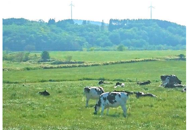
宗谷酪農を代表する放牧の風景