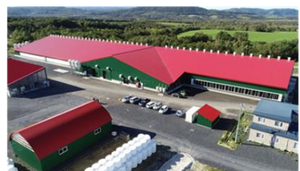
補助事業を活用して整備された牛舎