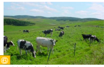
⑥ おおきほそうちほくじょう 大規模草地牧場（豊富町） 総面積1400haと日本有数の規模を誇る牧場。見渡す限り続く丘陵地帯には、乳牛が放牧され牧歌的な風景を見せています。