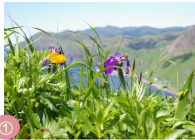
① 「花の浮島」礼文島 礼文島は、夏に約300種類もの花が咲く「花の浮島」となります。レブンアツモリソウやレブンウスユキソウなど礼文島固有種もあります。