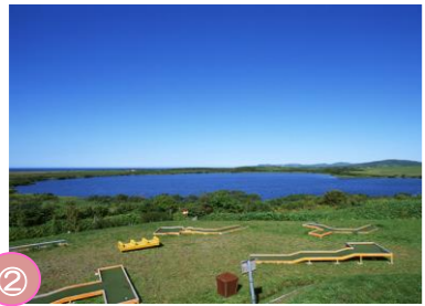
② メグマ沼 稚内空港にほど近いところにある、丸い形をしたメグマ沼。沼周辺約78haの湿原では、エソカンソウやノハナショウブなど約200種類の花が咲きます。