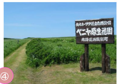
④ ベニヤ原生花園 浜頓別町に広がる原生花園。海沿いに広がる約330haの原生花園には、春から秋にかけてエソカンソウなど約100種類の花が咲きます。