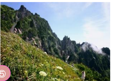
⑤ 利尻島の高山植物 日本海に浮かぶ利尻島は貴重な高山植物の宝庫となっており、リシリヒナゲシやリシリゲンゲのような固有種も観ることができます。