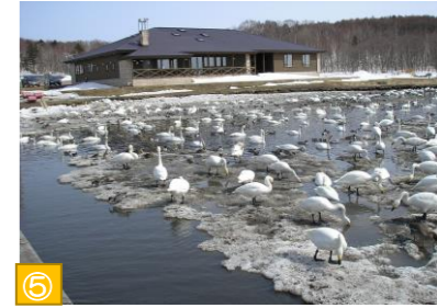
⑤ クッチャロ湖（浜頓別町） 平成元年、日本で3番目にラムサール条約登録湿地に指定されました。春と秋には約2万羽もの白鳥を観ることができます。