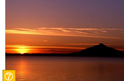
⑦ パンケ沼（幌延町） パンケ沼にはイトウが生息し、秋にはヒシクイや雁等の渡り鳥の通り道にもなっています。