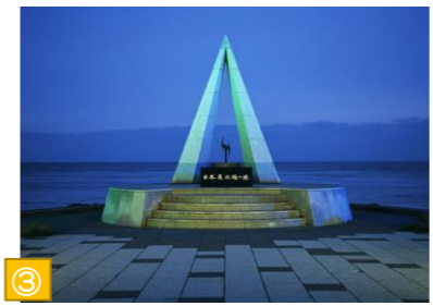
③ 宗谷岬（稚内市） 北緯45度31分22秒に位置する北海道本土の「てっぺん」。日没後はライトアップされ、幻想的な光景を見られます。