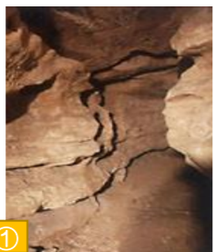
① 中頓別鍾乳洞（中頓別町） 1000万年前は海の底だったといわれる鍾乳洞。石灰岩が長い年月をかけて溶けてきた軍艦岩なども観ることができます。