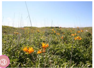
③ エサヌカ原生花園 猿払村に広がる原生花園。あまり人の手が入っていないのが特徴で、ハマナスやワタスゲ、コケモモなど数十種の花が咲きます。