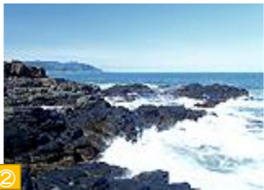
② ウスタイベ千畳岩（枝幸町） 一面に畳を敷きつめたような岩々が波打ち際まで広がり奇観を呈しています。冬には間近に流水を観ることができます。