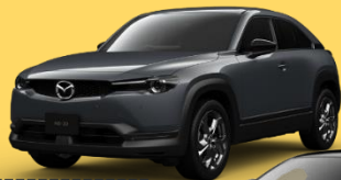
マツダ MX-30 (EV)