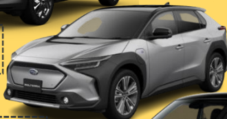
スバル ソルテラ (EV)