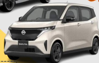
日産 サクラ (EV)