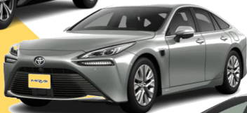
トヨタ MIRAI (FCV)