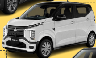
三菱 eXクロス (EV)