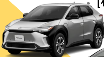
トヨタ bZ4X (EV)