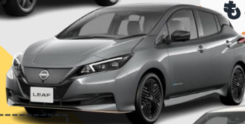
日産 リーフ (EV)