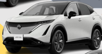
日産 アリア (EV)