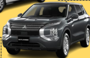
三菱 OUTLANDER (PHEV)

※上記車両画像と 展示車・試乗車のボディーカラーが異なる場合がございます。 展示のみの車両もございますのでご了承ください。