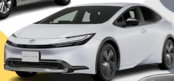
トヨタ プリウス (PHV)