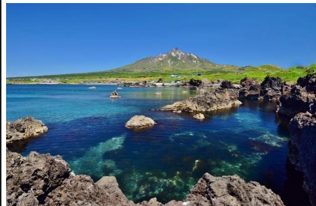
仙法志御崎から望む利尻富士