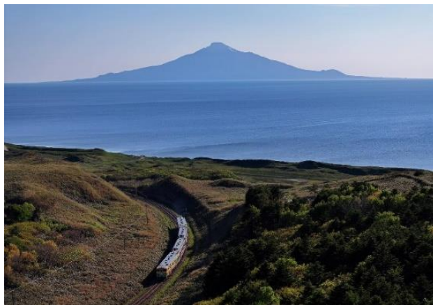
花たび宗谷と利尻富士