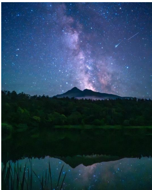
星降る夜の利尻富士