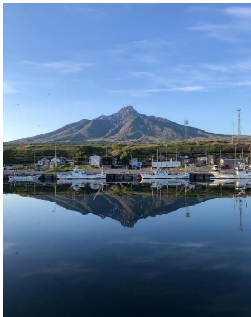
仙法志漁港にホッケ釣りへ