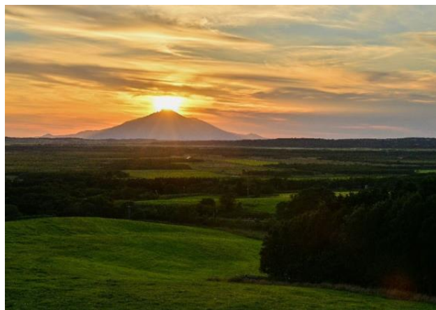
原野とダイヤモンド利尻富士