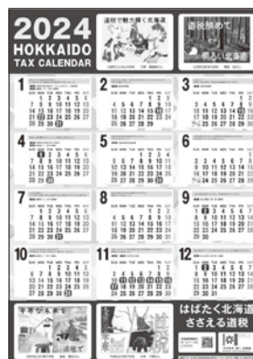
2024年 道税カレンダー