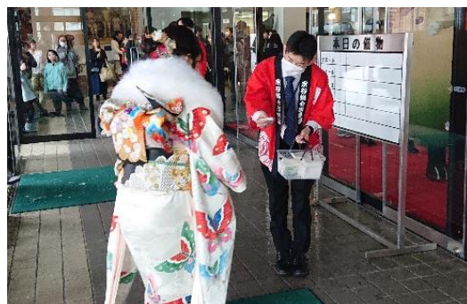
稚内市20歳の集い でのPRカード配付