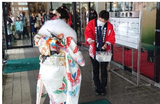
稚内市20歳の集いでのPRカード配付