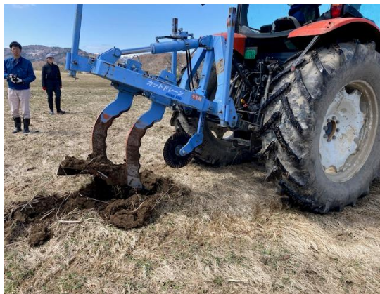
写真4 施工中のほ場