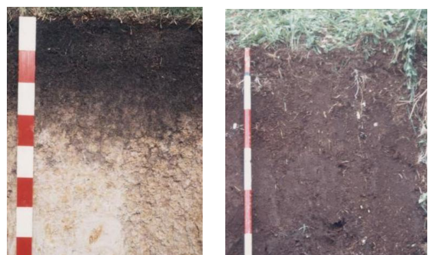
写真2 左：灰色台地土、右：泥炭土（参照：道総研）