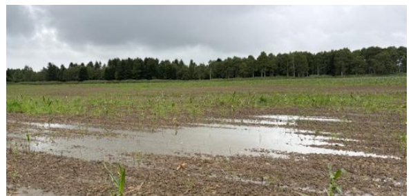
写真1 降雨後に滞水しているほ場