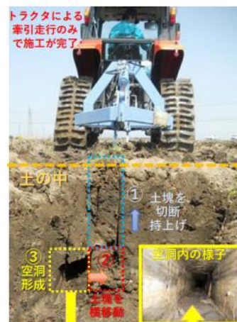
写真5 カットドレーンの仕組み (参照：農研機構)