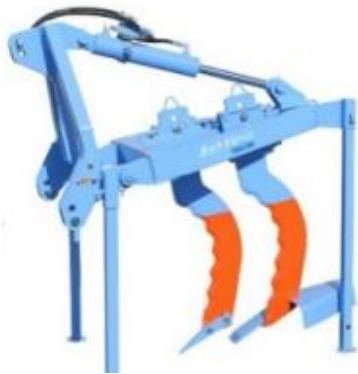
写真3 カットドレーン (参照：農研機構)

施工機をトラクタで牽引走行し、ほ場の地表面から 40～70cm の深さに空洞を形成することで排水不良の解消を狙うものです。管等の資材を用いることなく、土中に排水可能な空洞を深い位置で構築できるため、平坦で粘質な農地に対する排水改良に利用されています（写真3～5）。