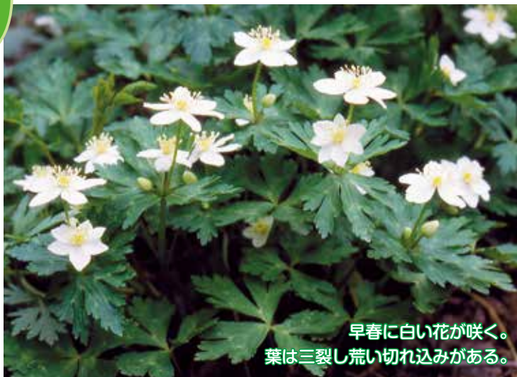
早春に白い花が咲く。 葉は三裂し荒い切れ込みがある。