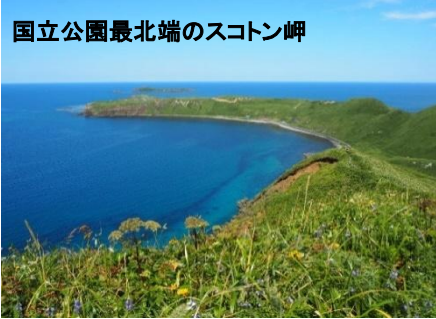
国立公園最北端のスコトン岬