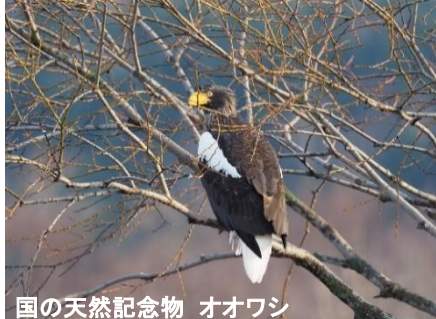
国の天然記念物 オオワシ