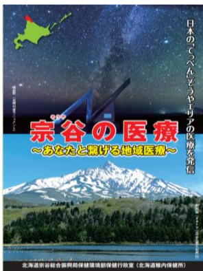
R5年度作成パンフレット

管内での医師や看護師をはじめ様々な医療従事者の不足が課題となっており、医療従事者への取材やパンフレットの作成など、総合的な確保対策に取り組んでいます。