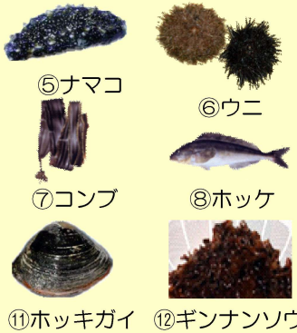
⑤ナマコ ⑥ウニ ⑦コンブ ⑧ホッケ ⑪ホッキガイ ⑫ギンナンソウ