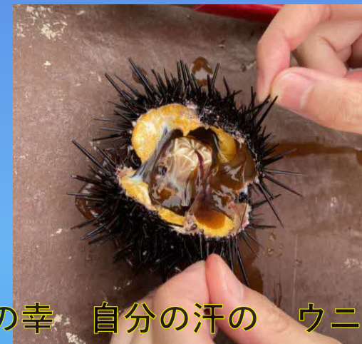
海の幸 自分の汗の ウニの味

また、テーブルセットや無料の望遠鏡もあり、ゆったりとした時間を過ごすことができます。