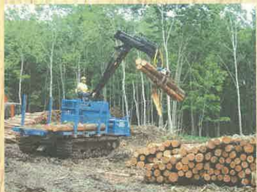
フォワーダ：材を載荷して、現場内の小運搬をする車両。