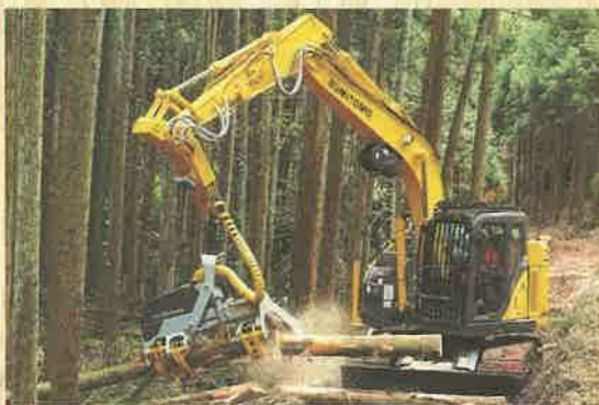
ハーベスタ：立木の伐倒・材の枝払い・玉切りまでの一連の工程を1台で行う機械。