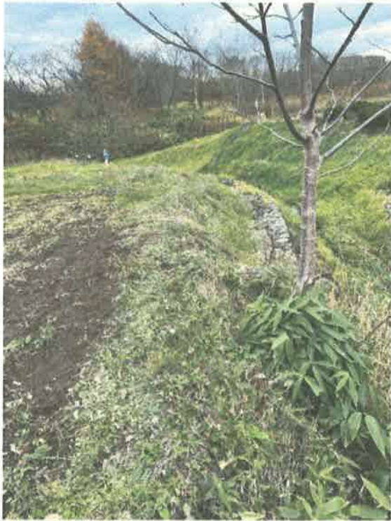
幌延川（上流から撮影）