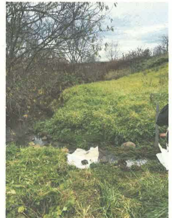
吸着マット設置状況