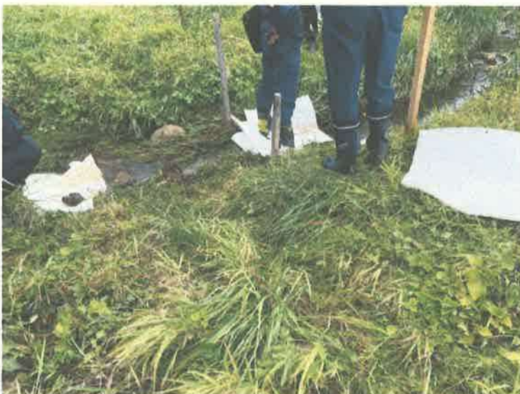
吸着マット設置状況