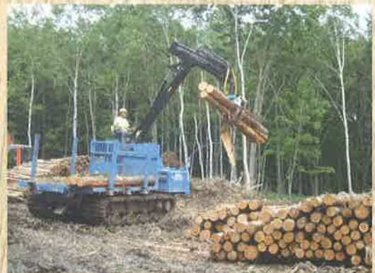
フォワーダ：材を載荷して、現場内の小運搬をする車両。