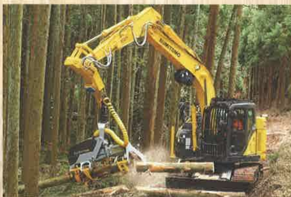
ハーベスタ：立木の伐倒・材の枝払い・玉切りまでの一連の工程を1台で行う機械。