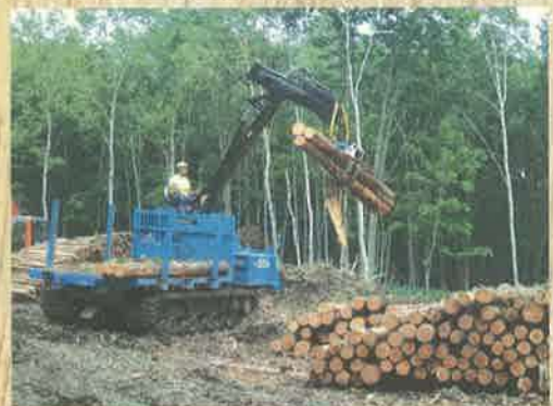
フォワーダ：材を載荷して、現場内の小運搬をする車両。