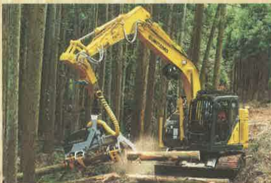
ハーベスタ：立木の伐倒・材の枝払い・玉切りまでの一連の工程を1台で行う機械。