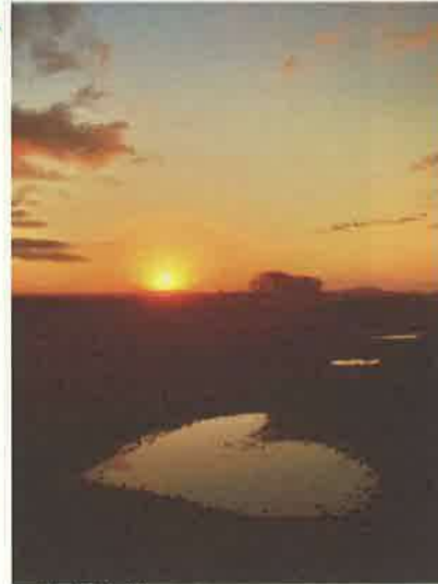
撮影地：稚内市