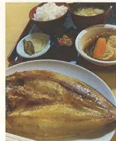
撮影地：礼文町