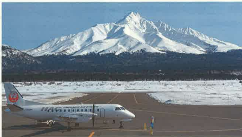
撮影者：katsuya09.29 撮影地：利尻富士町