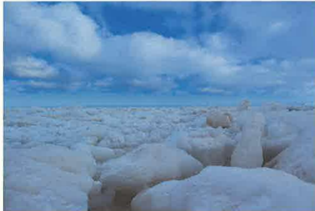
撮影者：ocr2011 撮影地：猿払村