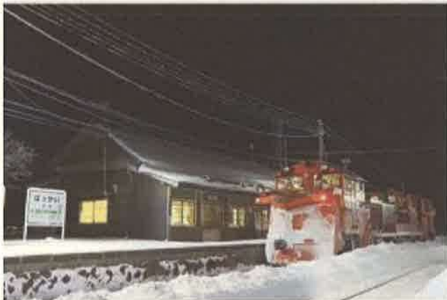
撮影地：稚内市