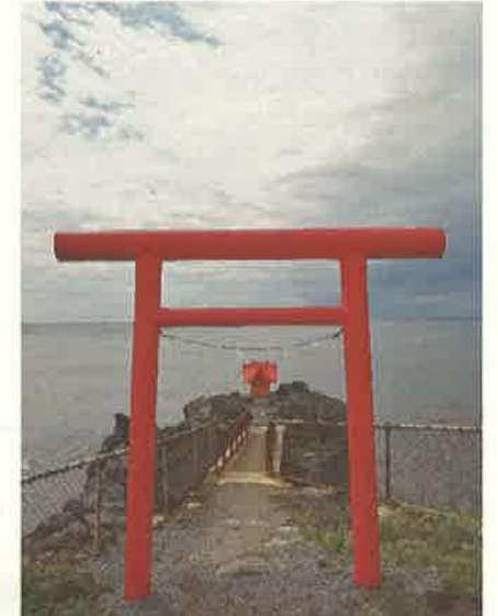
撮影地：利尻町