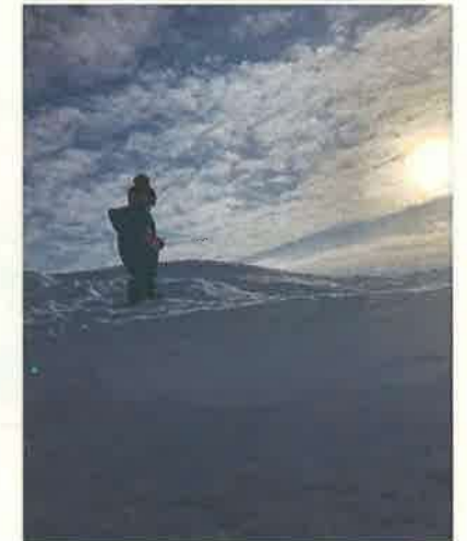
撮影者：koruti7 撮影地：中頓別町