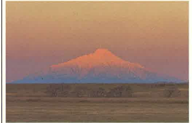
撮影地：天塩町