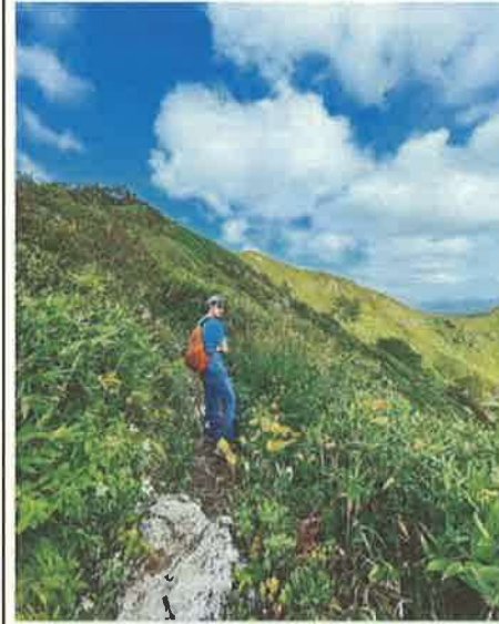
撮影地：中頓別町