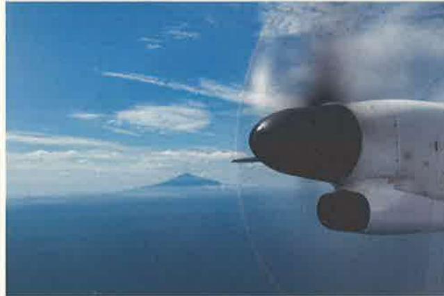
撮影者：701sq74747c 撮影地：稚内市