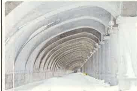
撮影地：稚内市