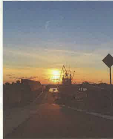
撮影地：礼文町