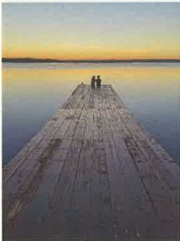
撮影地：浜頓別町