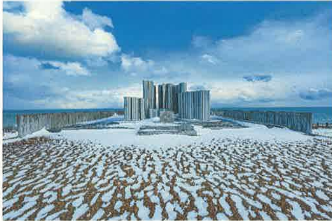
撮影者：yuto_hokkaido_japan 撮影地：猿払村