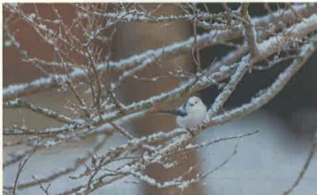
撮影地：中頓別町