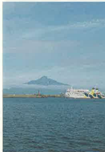
撮影地：礼文町