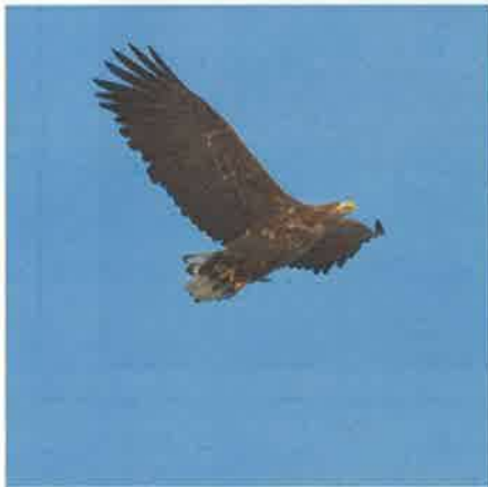
撮影地：浜頓別町