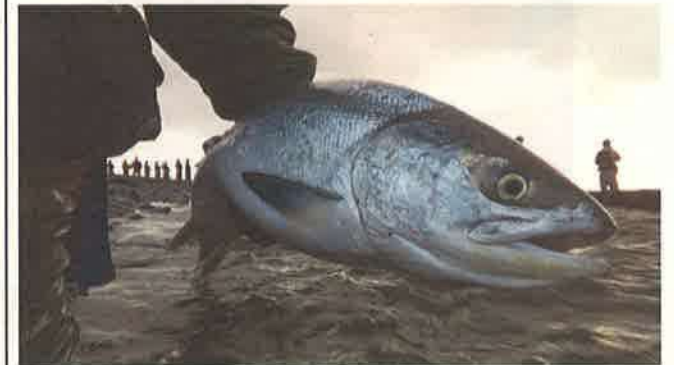
撮影地：枝幸町