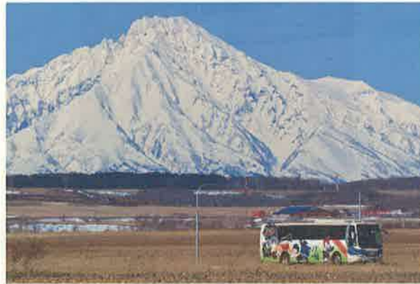
撮影地：豊富町