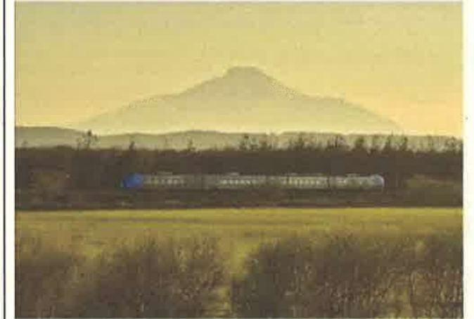
撮影者：northern.four.seasons 撮影地：豊富町