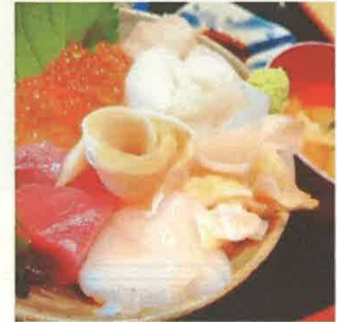
撮影地：枝幸町