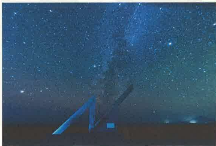
撮影地：幌延町