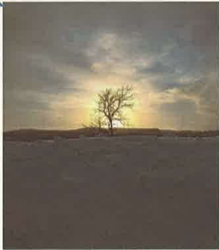
撮影地：稚内市