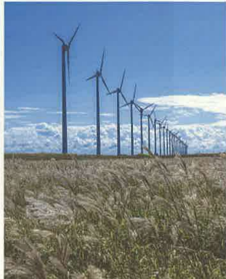
撮影地：幌延町