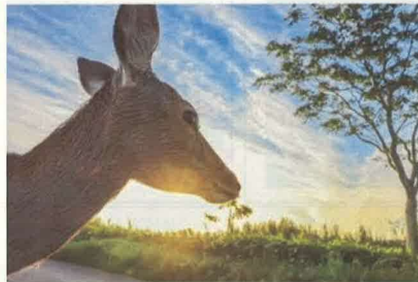
撮影地：稚内市