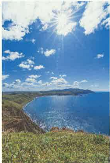
撮影地：礼文町