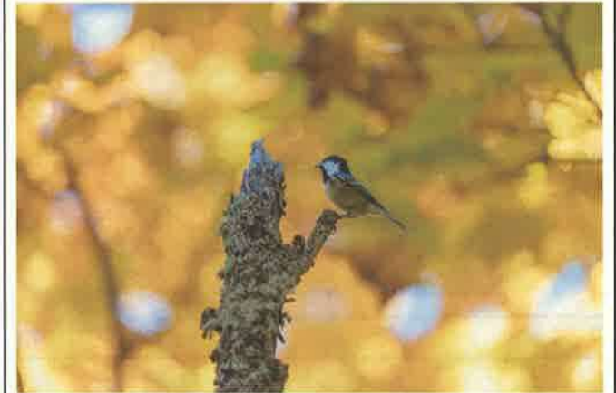
撮影地：猿払村