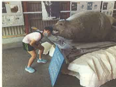
撮影者：caihua1381 撮影地：稚内市