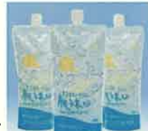
商品例・豊富温泉濃縮水（入浴・肌用）

豊富温泉は皮膚によく知られていますが、遠くお越しになれないとの声もあり、お役に立ちたいとの思いをこめて作りだしたのが、『豊富温泉濃縮水 サロベツ大地恵泉』です。源泉を7倍に濃縮しています。