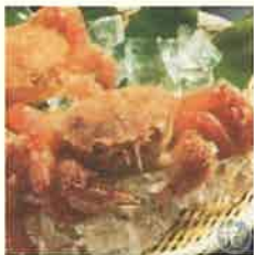
商品例 枝幸産毛ガニ

北海道枝幸町（えさしちょう）が誇る自慢の海産物や山の幸、銘菓などを取り扱う枝幸町特産品ショップです。