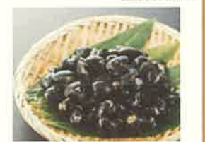
商品例・天塩のしじみ

天塩の自然が育んだ、上品な風味と大粒で濃厚な味は、絶品です。天塩町の特産品「しじみ」をとくとご堪能あれ！