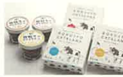
商品例・放牧牛のアイスクリームとカタラーナ

放牧牛の優しい甘みを感じられ、すっきりとした後味のアイスクリーム。優しく混ぜるとゼラートのような触感がオススメです。牛乳の風味がたっぷりと味わえるカタラーナは、柔らかくなってから、一口サイズでお召し上がりください。