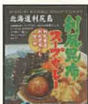
商品例 利尻昆布スープカレー

2021年8月にオープンしたばかりのECショップです。利尻島の特産品である「リシリコンブ」や「ウニ」をはじめとした海産物の他、オリジナル商品の「利尻昆布ラーメン」や「利尻昆布スープカレー」等、利尻島ならではの産品を多数販売しております。