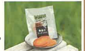
商品例・黄金のフィナンシェ

道北中頓別町産ハチミツ、地元素材使用のスイーツ、北海道のお土産品などなど、お買い物をお楽しみ下さい♪