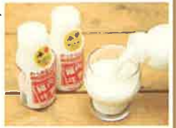
商品例・稚内牛乳

「日本のてっぺん」稚内の豊かな自然で生まれた、農畜産物や水産物、生産される産品や地域資源を「稚内ブランド」として認定し、広く発信することで知名度向上を図っています。ぜひ、稚内自慢の味をお楽しみください。