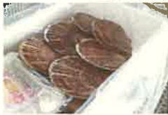
商品例 猿払村の活ほたて

全国でも有数のほたての名産地。厳しい天然の環境で稚貝を撒き、低い水温の地域で育ったほたては甘みと旨みが強く4年をかけて育てられます。その間、順調に成長したほたての海の幸をご賞味ください。