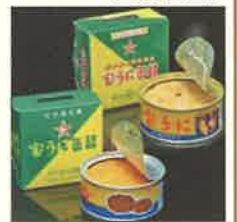
商品例・宝うに缶詰

北海道の北に位置する礼文島は、四方を豊饒な海に囲まれております。一年を通して豊富な海産物が水揚げされます。味・鮮度ともトップクラスの産品を産地直送で皆様のもとへお届けいたします。