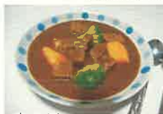
商品例 秘境牛ビーフシチュー

北海道幌延町で育てられるホルスタインのうち、経産牛（子を産んだ牛）を肉牛として4か月以上肥育したものを「秘境牛」と呼んでいます。牧草自給100%、和牛用の飼料を使って育てており、肉質の向上を図っています。ぜひ召し上がってみて下さい！