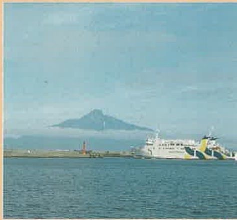
Instagramフォトコンテスト「#私が見つけた宗谷」入賞作品

「宗谷エリア」の 各市町村には、 自慢の逸品がたくさん！ ネットでも買える逸品を ご紹介します。