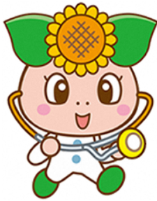
いきサポ公式キャラクター ひまわりちゃん

このサイトは、 医療機関の勤務環境の改善に 役立つ 各種情報 や 医療機関の取組み事例 を紹介しています。