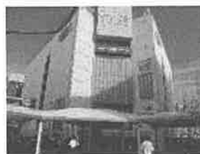
どさんこプラザ町田店が入居する 「町田東急ツインズEAST」