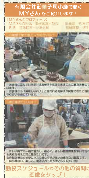
1月配信 (拡大したものは裏面)