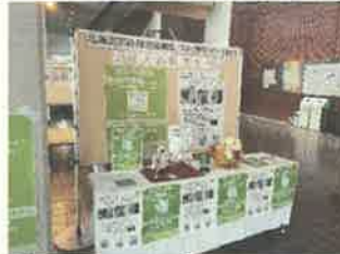
振興局ブースを設置