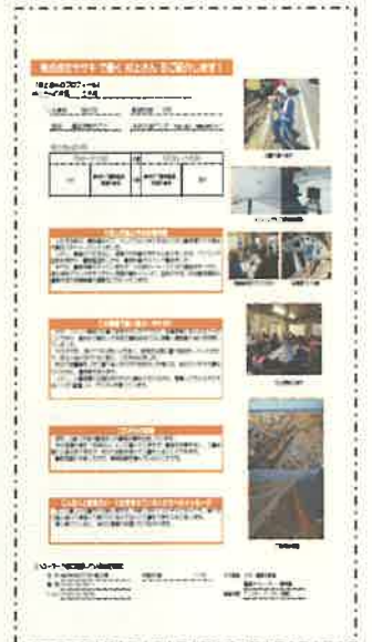
宗谷で活躍する人 (振興局HPに掲載中)