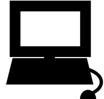
インターネットバンキング ダイレクト納付