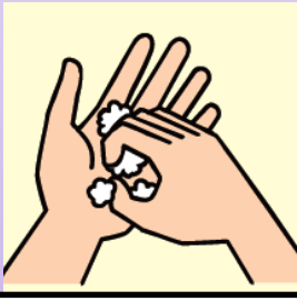
指先、爪の間 手のしわ