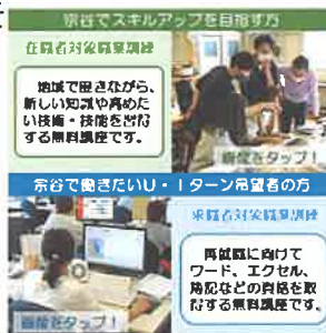
職業訓練について