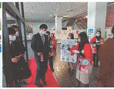
稚内市20歳の集いでPRカード配付