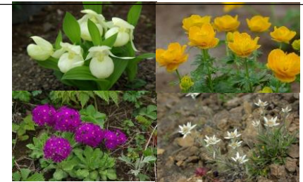
<レプンアツモリソウ レプンキンバイソウ レプンコザクラ レプンウスユキソウ>