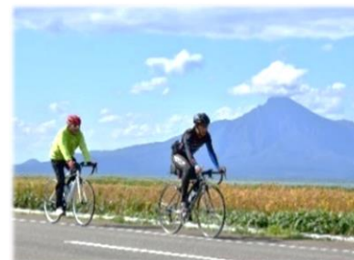
<「サイクリングinてっぺん宗谷」より>