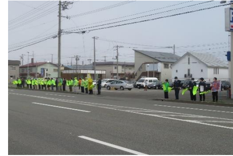
<R5交通事故死ゼロを目指す日旗波啓発>