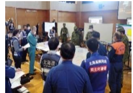
<R4 指揮室運営等図上訓練>