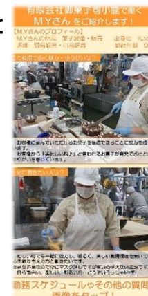
<LINE配信「宗谷で活躍する人」>