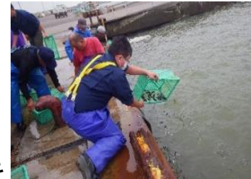
<R4 ヒラメ・ニシン放流>