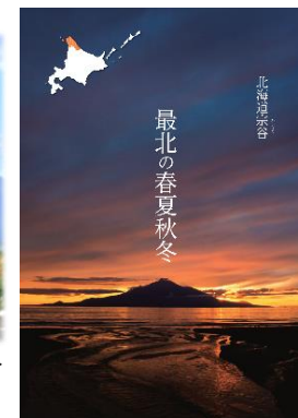
<R5 観光パンフレット>