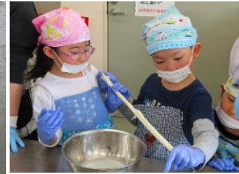
<R4 チーズづくり体験会>