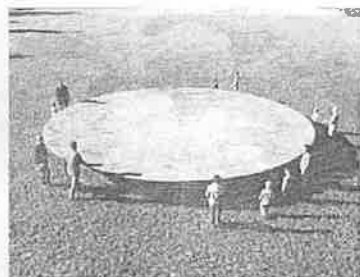
4 Plate (of 100 meters arc)