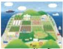
むら わが農山漁村

むら わが農山漁村を知ってもらい、好きになってもらうため、地域ぐるみでファンづくり！