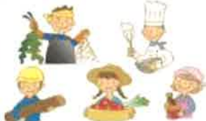
地域ぐるみで魅力発信