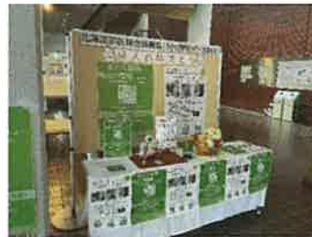
振興局ブースを設置 (R5参考)