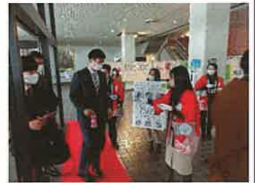
PRカードの配付(R5参考)