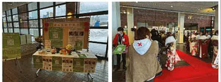
稚内市20歳の集いで振興局ブースの設置(左)及びPRカード配付(右)