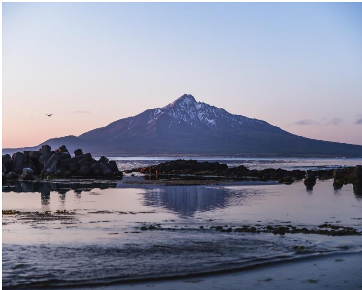
夜明け後の雪の残る利尻富士