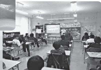
聞き入る子供たち