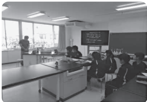
ホッケの生態等について講義