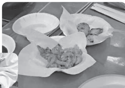
貝ヒモと貝柱のソテー