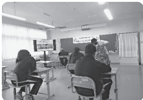
種苗生産について説明