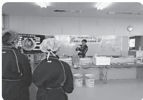
ホタテ漁業等について講義