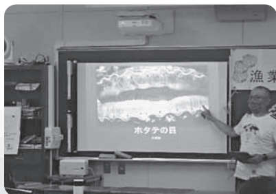
生態などについて説明