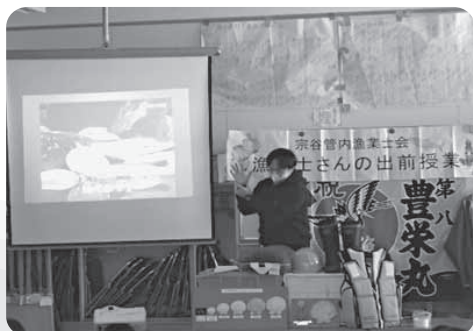
ホタテの生態等について講義