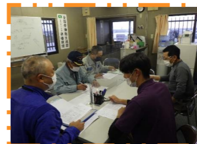
現場事務所での打合せ

入社する前は、建設業なので、テレビでよく目にするような工事現場で穴を掘る作業などをイメージしていました。 しかし、実際に入社すると、現場での作業もちろんありましたが、パソコンで図面を見たり、書類整理をしたり、事務作業がメインで驚きました。 今では、事務作業も行っていますが、入社前のイメージどおり道路を作ったり、海の消波ブロックを作ったりと現場作業をメインに、図面の作成、安全管理関係の書類作成や現場写真の撮影なども行っています。