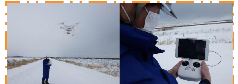
ドローンでの工事写真撮影