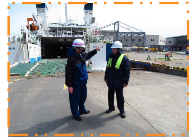
船員とのやりとり