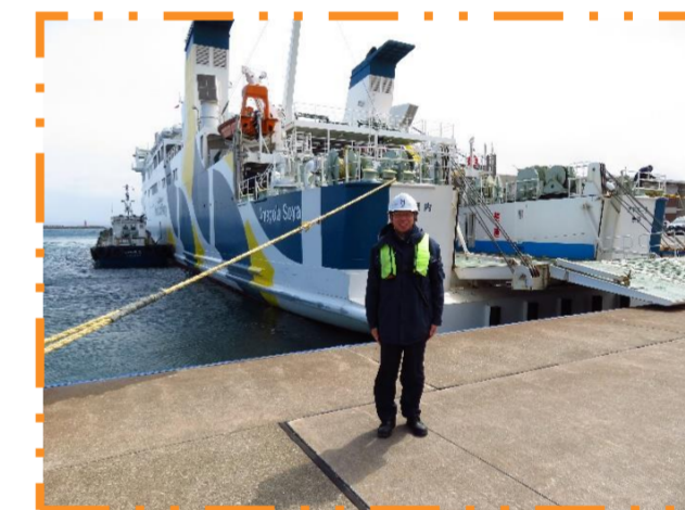
アマポーラ宗谷 船尾にて