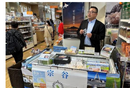
(事業者様も店頭で直接PR(左:天塩の國様(天塩町)、右:群来留様(利尻町)))