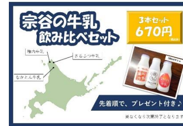
牛乳飲み比べセット企画