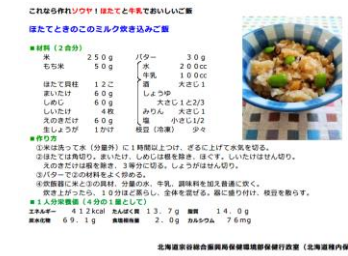
牛乳とホタテのレシピ