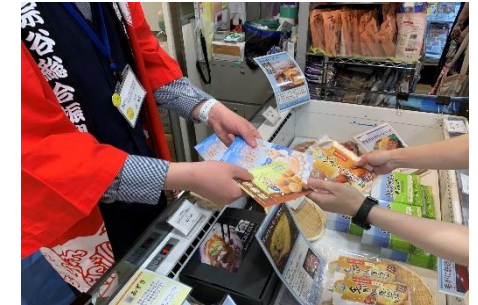
(水産課と協力し、ホタテ冊子を配布)