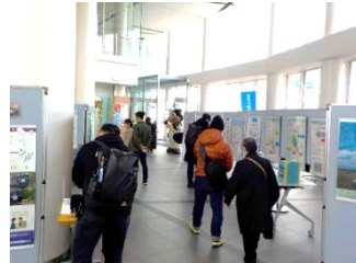
JA宗谷地区青年部による声かけと牛乳のお渡し