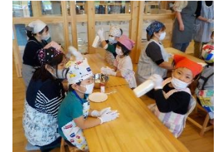
こども園向け（枝幸町）