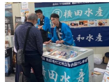
(横田水産様(浜頓別町))