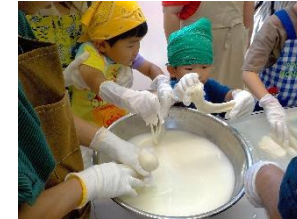
小学生向け（幌延町）