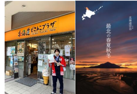
(来店者の多い時間に観光パンフレットを配布)

数あるアンテナショップの中でも売上や来店者数がトップの「どさんこプラザ有楽町店」には、連日多くのお客様で賑わっていました。