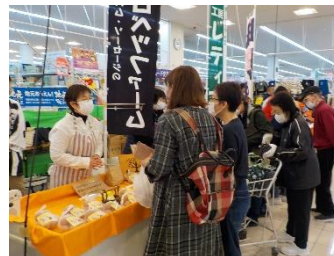
地産地消フェアのようす

シティ稚内店での「地産地消フェア」において、牛乳乳製品などの地場産加工品の販売・PRや地場産品の消費拡大につながるよう牛乳とホタテを使ったレシピの配布とともに、稚内市、猿払村、中頓別町で販売されている地域のこだわり牛乳の「飲み比べセット」を販売（10月21日～22日）