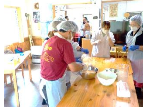
管外観光客向け（豊富町）