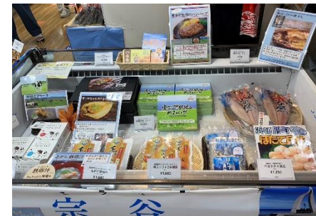
(全20種類の冷凍商品(左)と常温商品(右)を販売)