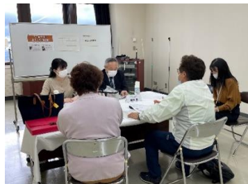
(シーグレイセス様(浜頓別町))